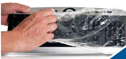
1. Schutzfolie überstülpen