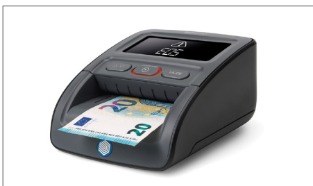
Prüft Banknoten auf bis zu sieben Sicherheitsmerkmale