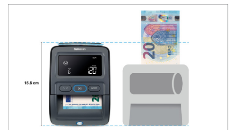
Hat im Vergleich zu anderen Produkten auf dem Markt eine der kleinsten verfügbaren Betriebsflächen