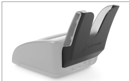
Safescan RS-100 Art. no: 112-0695