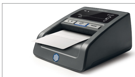
Reinigungskarten für Falschgelddetektoren