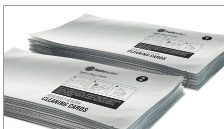
2 verschiedene Reinigungskarte für ein optimales Reinigungsergebnis