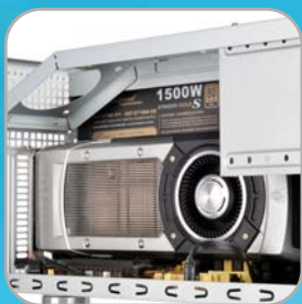
Für Grafikkarten jeglicher Länge