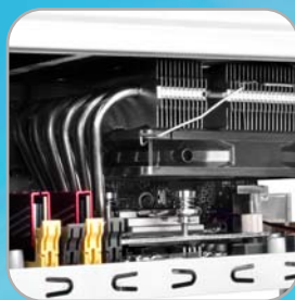
Reichlich Platz für CPU-Kühlung (82mm in Vertikalrichtung)