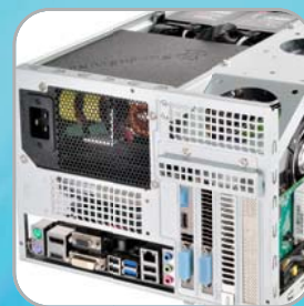
Kompatibel mit Micro ATX Mainboard & Standard-ATX Netzteil