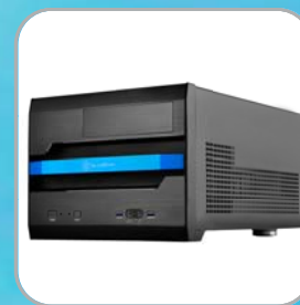
Übersichtlich konzipiertes SFF-Gehäuse mit modernisiertem Layout