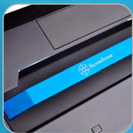
Integrierter Griff für einfachen transport