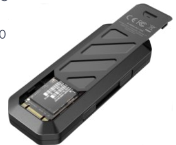
* Schutzbox für eine weitere M.2 SSD