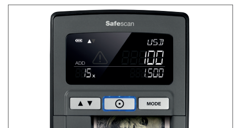
Zeigt die Menge und die Summe der geprüften Banknoten an