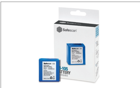
Safescan LB-105 Aufladbare Batterie Art. no: 112-0410