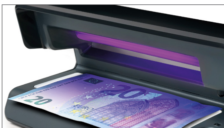
Prüft die UV-Merkmale von Banknoten