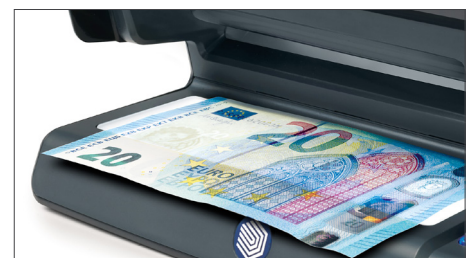
Großer LED Gegenlichtbereich zur Prüfung von Wasserzeichen, des Metallfaden und von Mikrotext