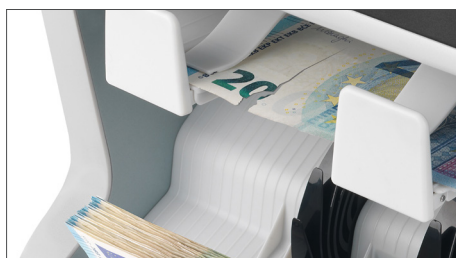
Identifiziert Banknoten, die nicht für den Umlauf oder Ihren Geldautomaten geeignet sind