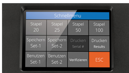
Hochauflösendem Touchscreen mit mehrsprachiger Benutzeroberfläche und Schnellmenü