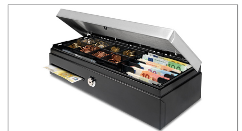
Robustes Designs aus Metall