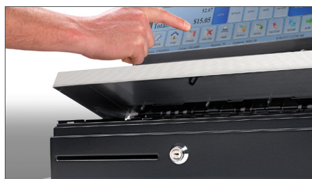
Einfache Kombination mit vorhandenen Registrierkassen und POS-Systemen